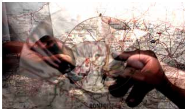
Photogrammes d'une création vidéo live avec des collégiens dans le cadre de « Dix Mois d'école et d'Opéra », spectacle présenté en Juin 2017, Opéra Bastille.